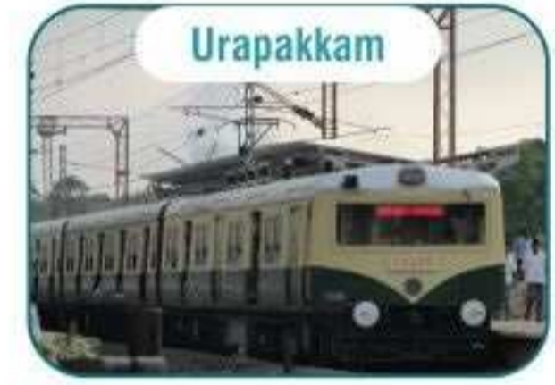
உரப்பாக்கத்தில் (GST) இருந்து 5 நிமிட பயண தூரத்தில்