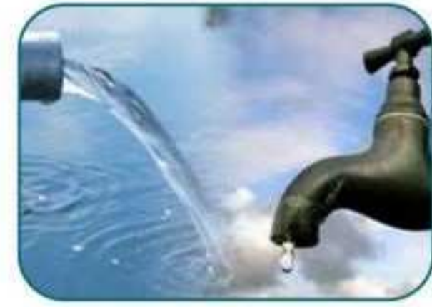
20 அடியில் சுவையான நிலத்தடி நீர்