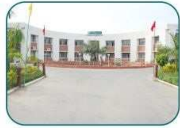
வடல்லி பப்ளிக் ஸ்கூல் 4 கி.மீ. முன்னதாக