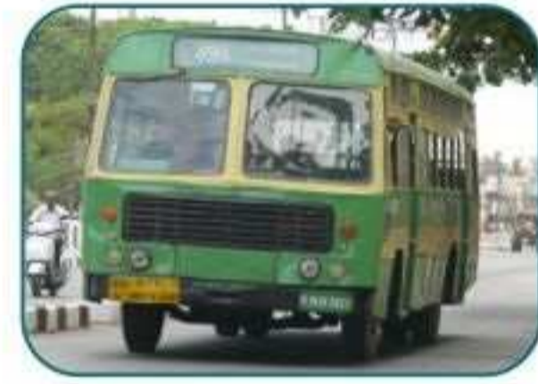
நேரடி பேருந்து வசதி