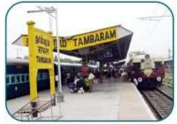
தாம்பரத்திலிருந்து 10 நிமிட பயண தூரத்தில்